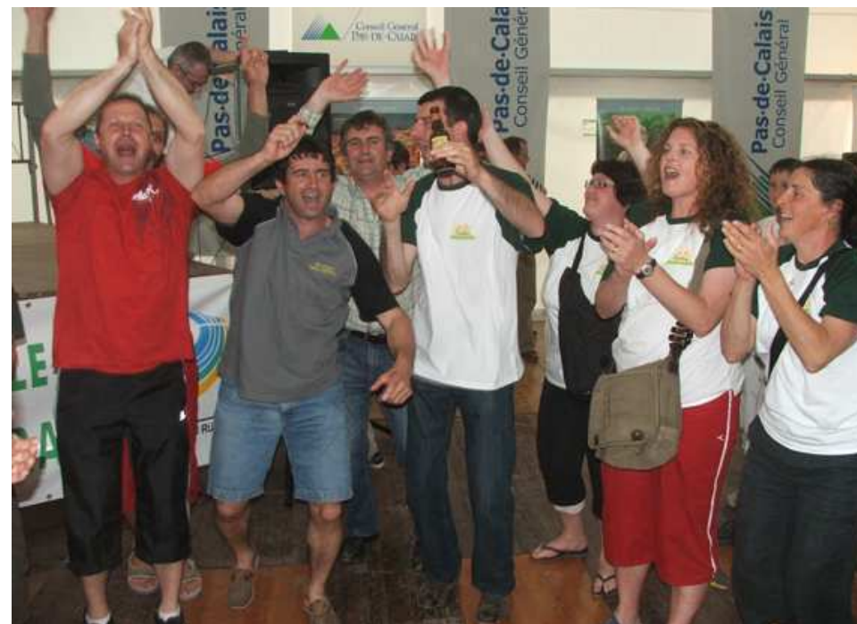
On sait faire la fête à l'Isle-Bouzon (Gers).