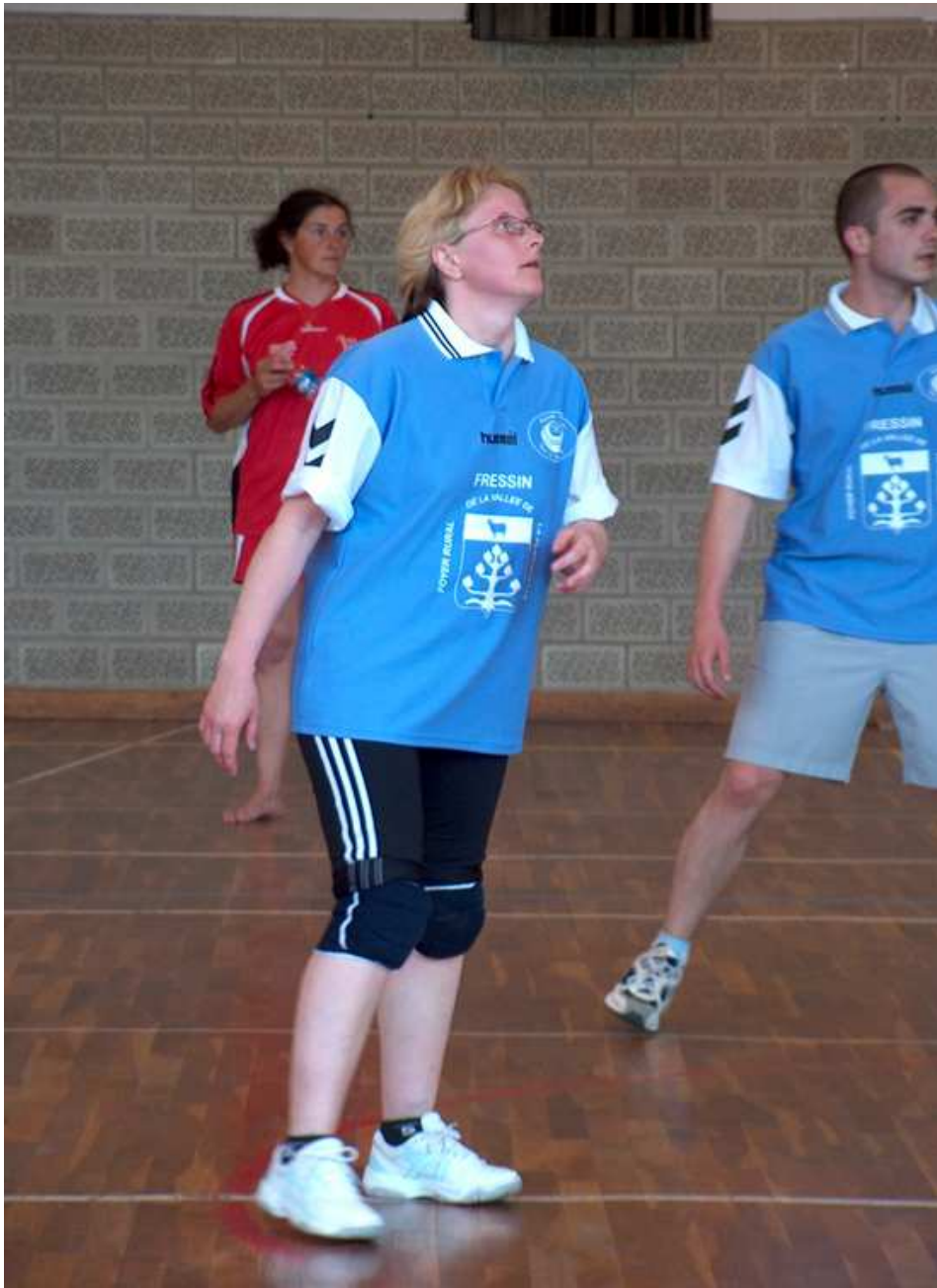
Pourvu que le ciel ne nous tombe pas sur la tête !