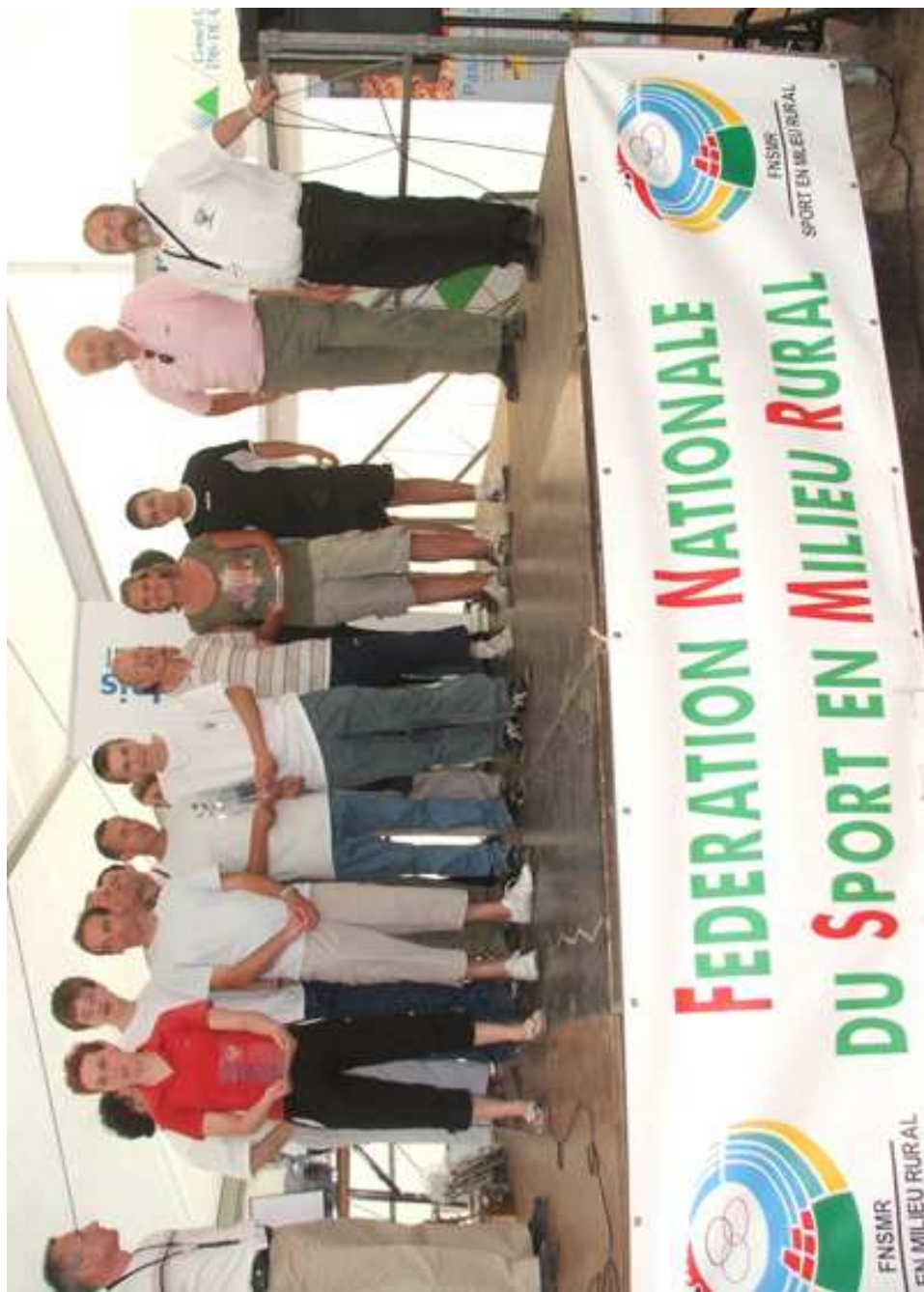
Preures champion en catégorie intergénérationnelle.