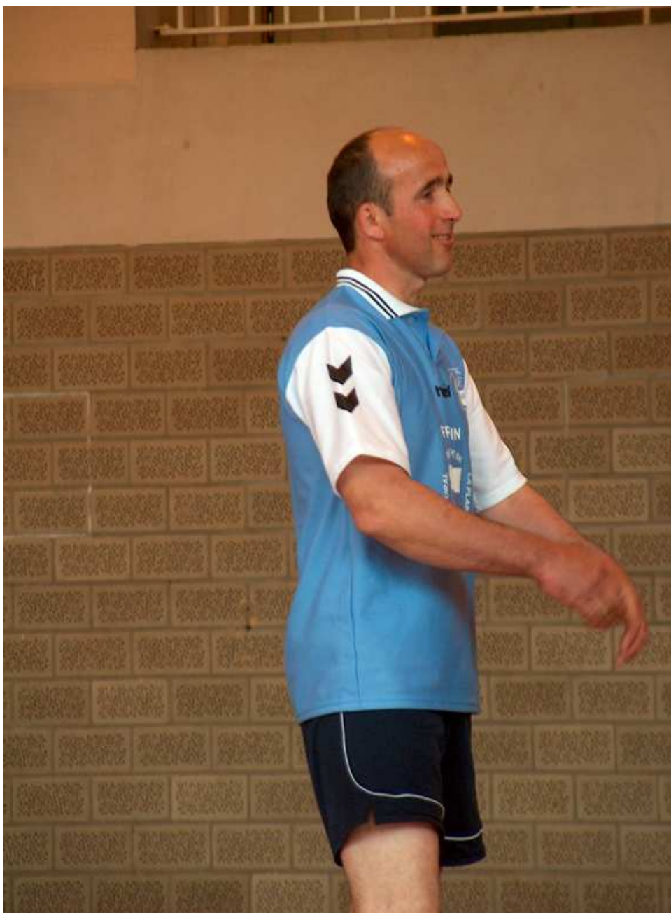
On n'est pas là pour rigoler hein !