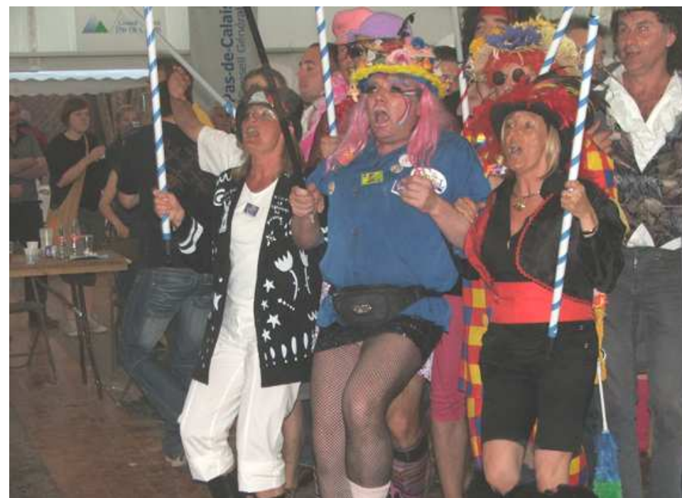
Dans le Nord-Pas de Calais aussi !