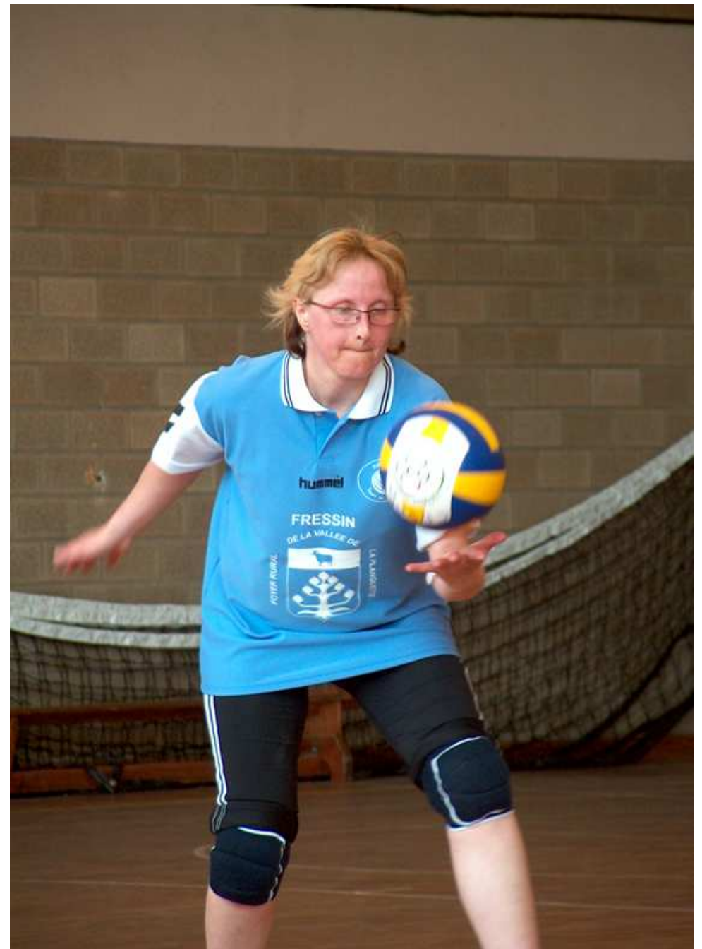
Faut que je m'applique là !