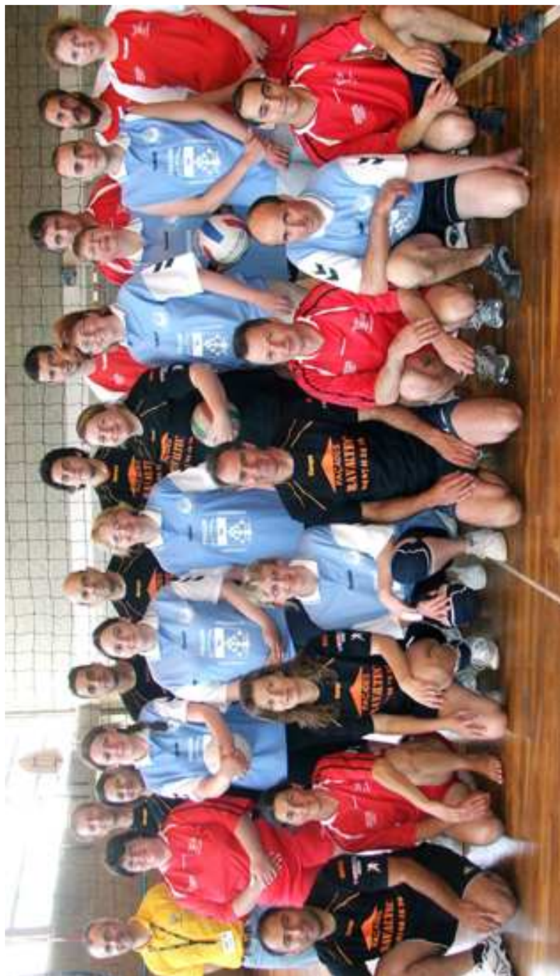
Les équipes de Fressin, Magalas et Isle-Bouzon