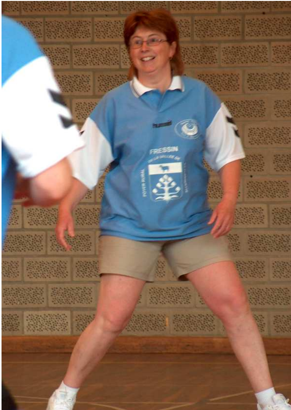
Ca rigole pour moi !