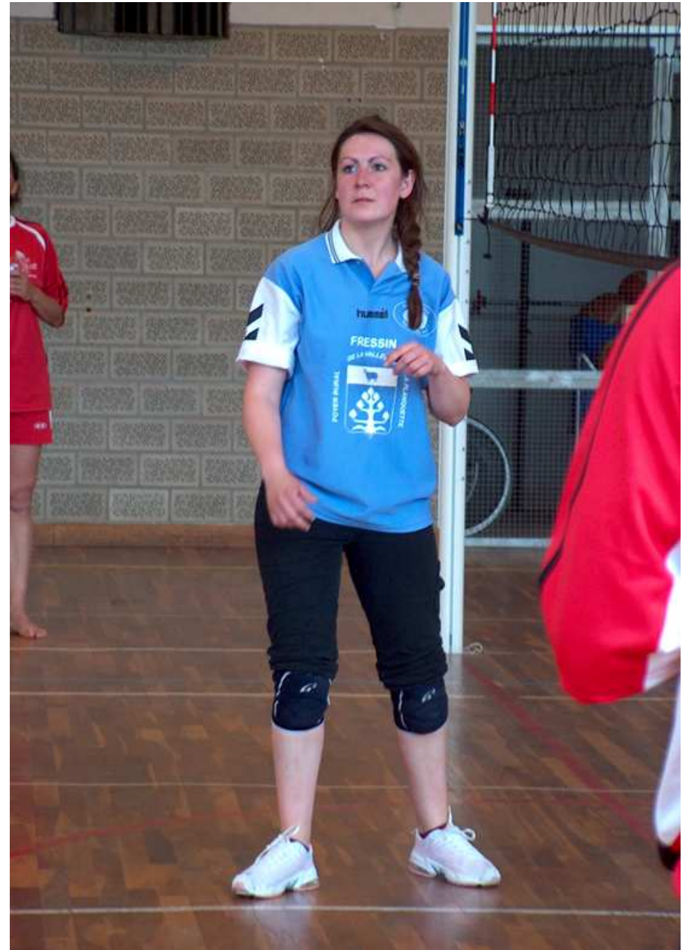
Aïe : je commence à me poser des questions !