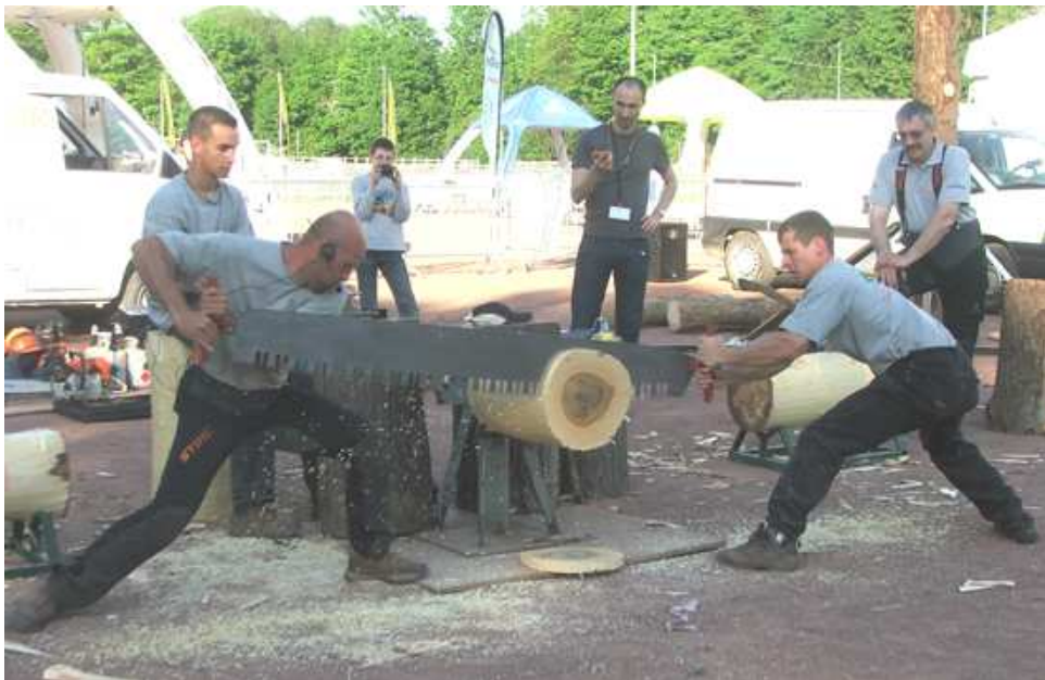
Démonstration de coupe de bois sportive.