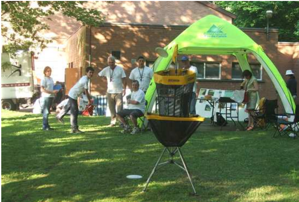
Démonstration de disc-golf.