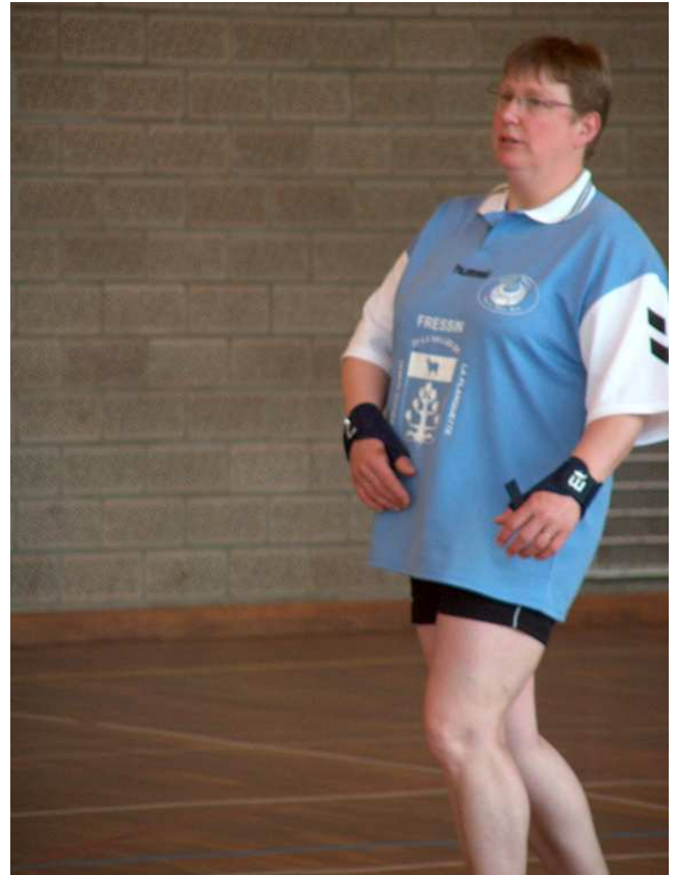
Ouh : j'y vas ti, j'y vas ti pas ?? (traduction : j'y vais ou j'y vais pas ?)