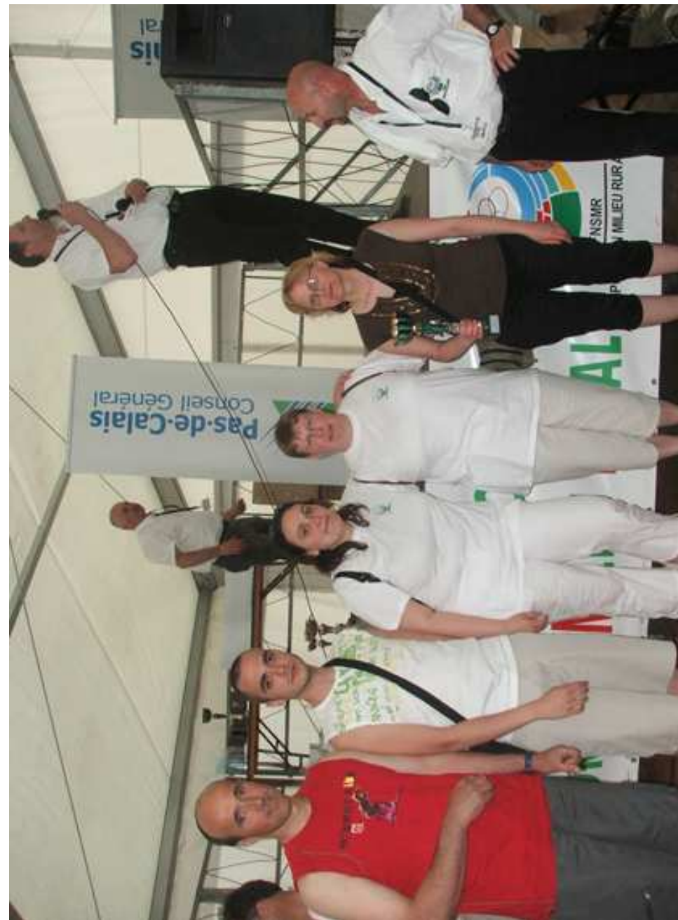
Fressin a obtenu la coupe du fair play : bravo à tous.