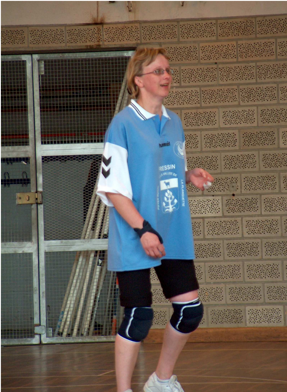
Bravo p'tite sœur !