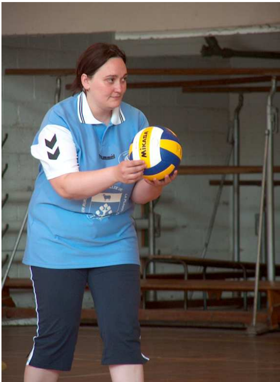
Raviss ben chel 'ale : té vas pon vire arrivé su n'œil ( Traduction : regarde bien celle-là tu vas pas la voir arriver sur ton œil.)